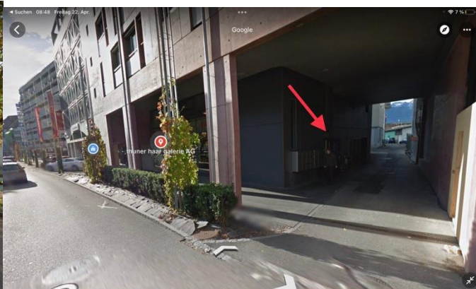
thuner haar galerie AG 4,8 ★★★★★ (19) Friseurkation - 409 km